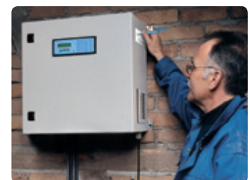
Steuerung und Verdichter der HUBER DeWaTec-Kleinkläranlage 3K PLUS® arbeiten abgeschirmt in einem externen, stabilen Schaltschrank, den es auch für die Außenmontage gibt.

HUBER DeWaTec GmbH Brassertstraße 251 45768 Marl Deutschland